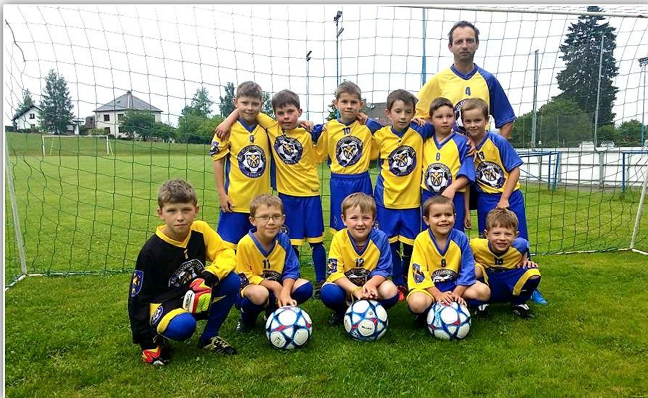
Nové dresy malých fotbalistů (vyfoceno 22. června 2015)