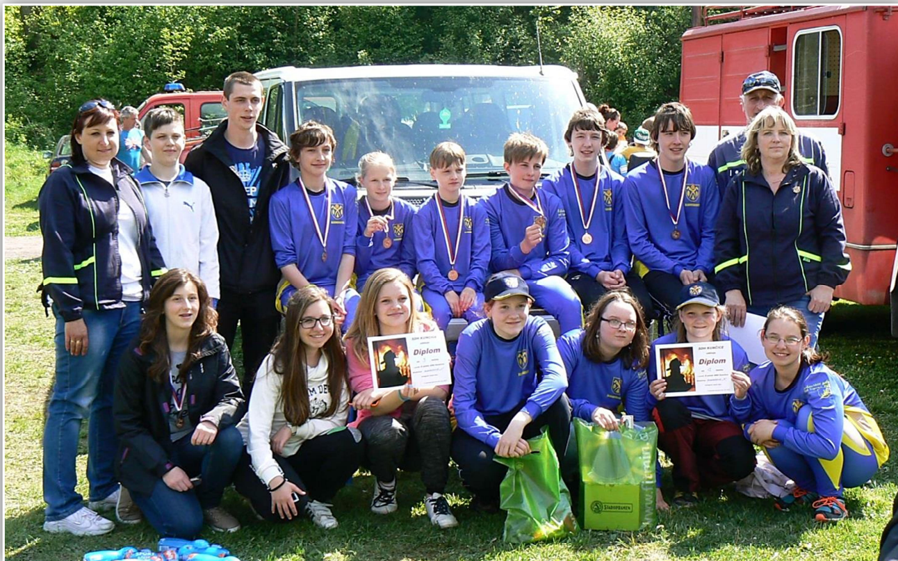
Mladí hasiči po úspěšných závodech v Letohradě na Kunčicích 10. 5. 2015, poprvé v nových dresech (viz příspěvek na straně 10)