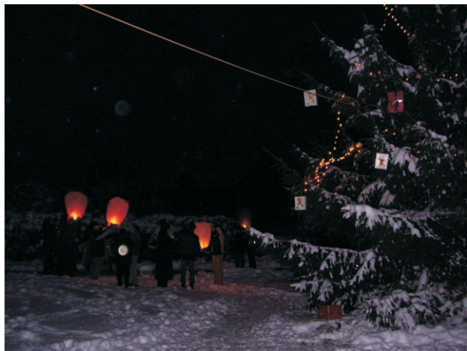
Rozsvícení vánočního stromu