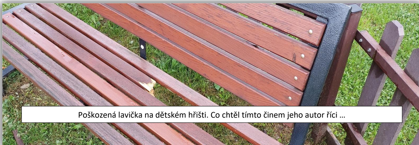
Poškozená lavička na dětském hřišti. Co chtěl tímto činem jeho autor říci ...