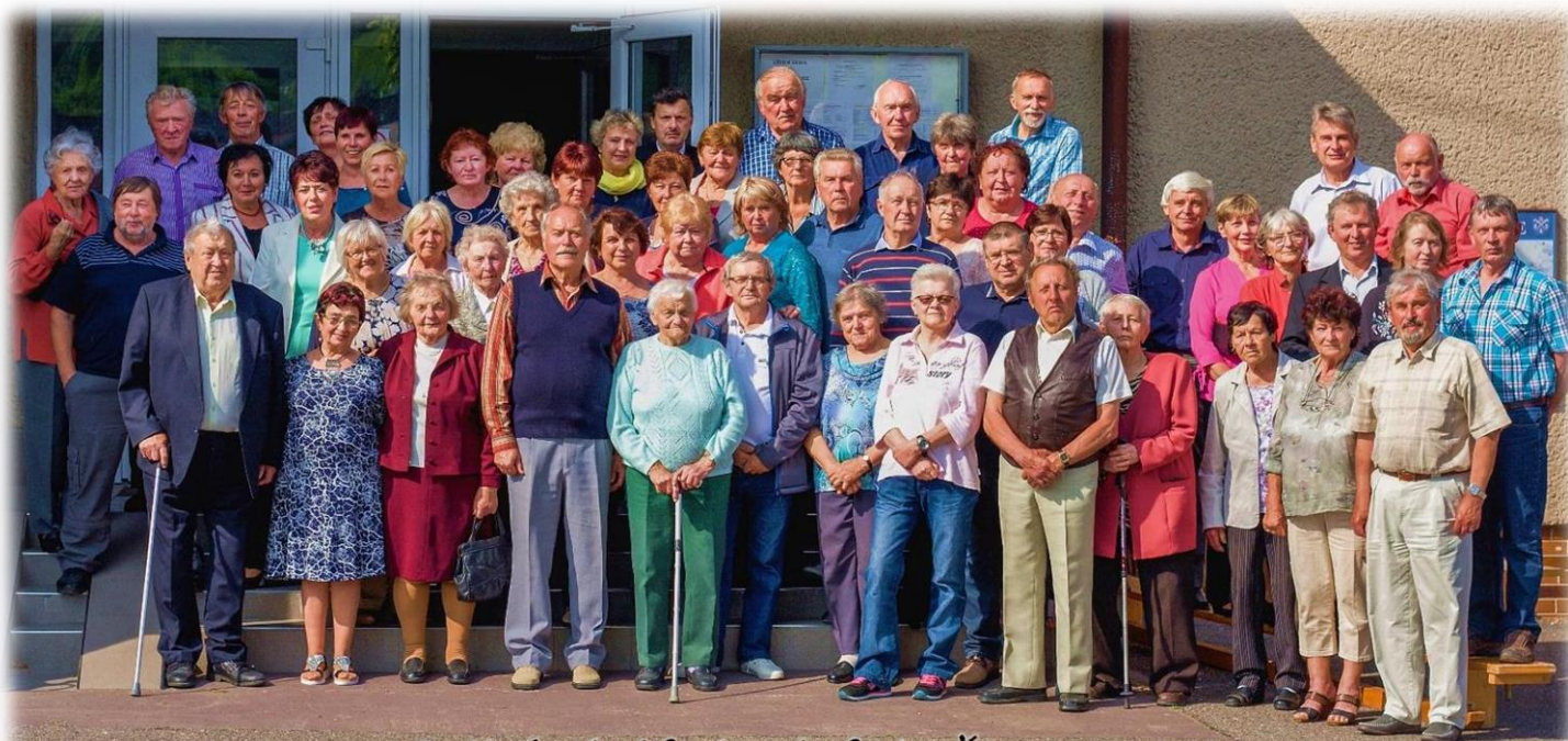
Setkání důchodců květen 2019