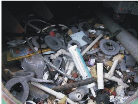
Tříděný odpad stále mnoha lidem nic neříká