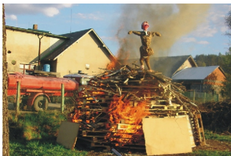
Hasiči i letos připravily pálení čarodějnic