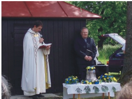
Svěcení zvonu proběhlo v neděli 27. 4. 2007