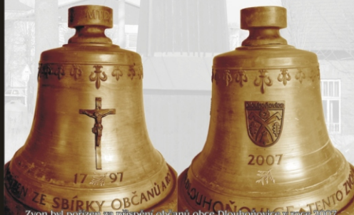
Zvon byl porizzen za přispění občanů obce Dlouhoňovice v květnu 2007

Zvon tloušťky výšky D3, spodního průměru 370 mm, hmotnosti 51 kg. Po obvodu pod úderovým věncem nápis: „Tento zvon byl porizzen ze sbírky občanů a rodáků obce Dlouhoňovice“. Z jedné strany věšáčka tuje s letopočtem 1797 a motivem „Kristus na kříži“, z druhé strany věšáčka tuje s letopočtem 2007 a známkou obce Dlouhoňovice. Na vrchní části zvonu po obvodu ille symbol křesťanství a na hlavě zvonu iniciály zvonácké dílny MTD Marie Tomášková - Dyrtychová.