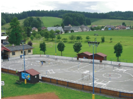
Dlouhoňovice mají nové dopravní hřiště