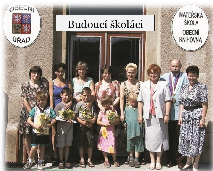
Oslava Mezinárodního dne dětí 2004.