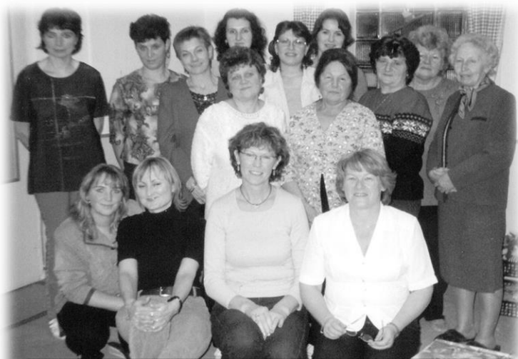
Setkání zaměstnanců MŠ 2006.

Děti podnikaly pestré výlety, divadla, saunování, plavání, návštěvy v základních školách, a také mnoho besídek připravily pro své rodiče a veřejné vystoupení při různých společenských akcích.