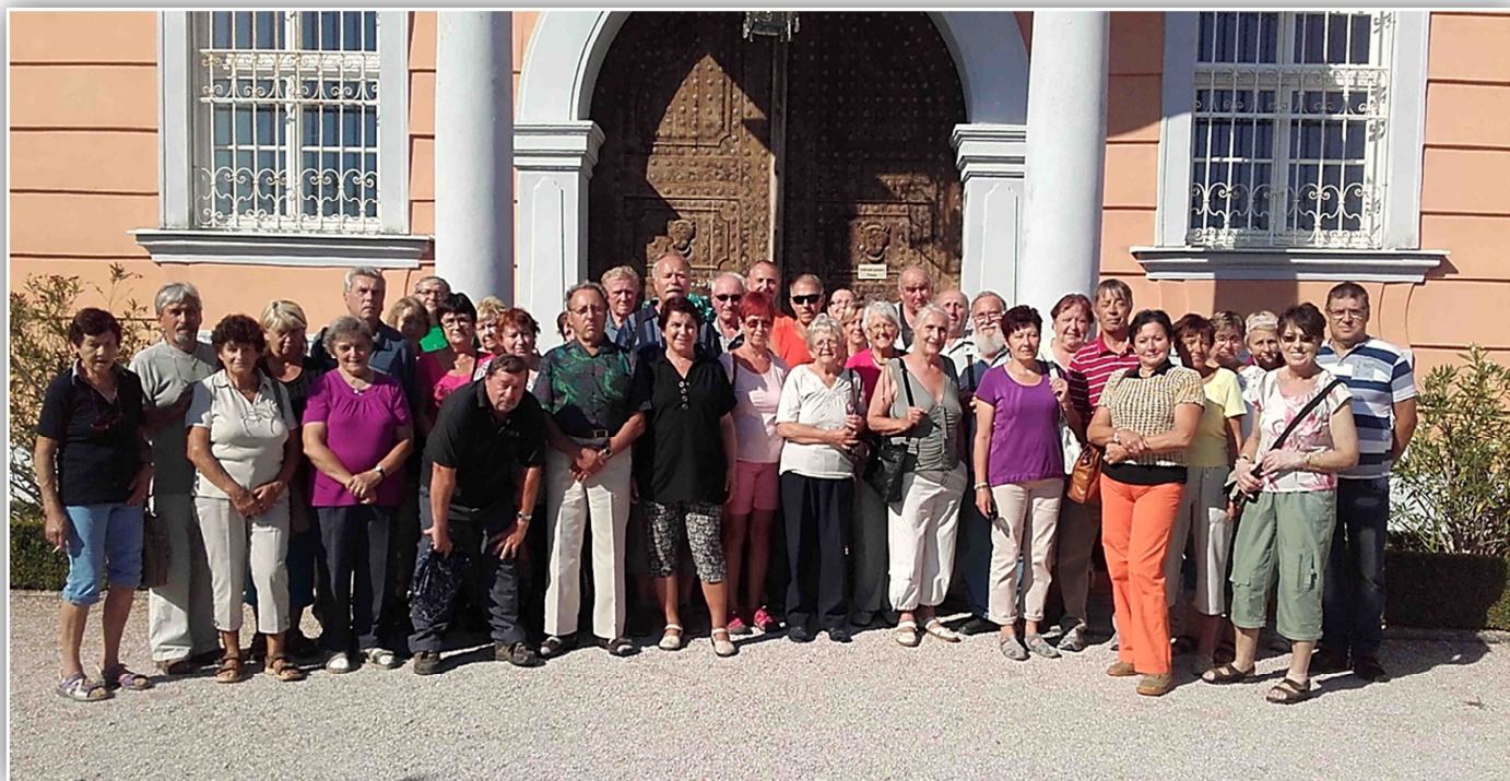
Zájezd důchodců na Vraclav, Košumberk a Nové Hrady - 26. srpna 2015. (viz příspěvek na straně 2)