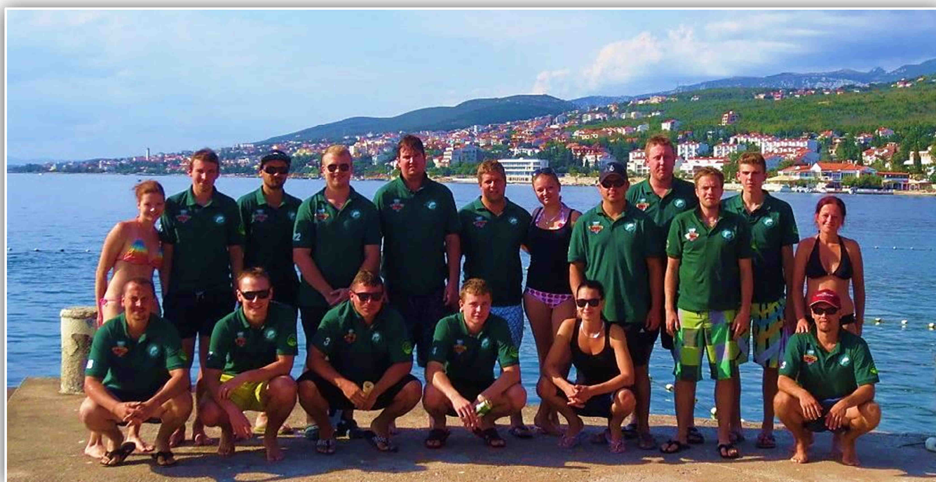
In-line hokejisté („Kapři“) na turnaji v chorvatském Záhřebu – září 2015. (viz příspěvek na straně 22)