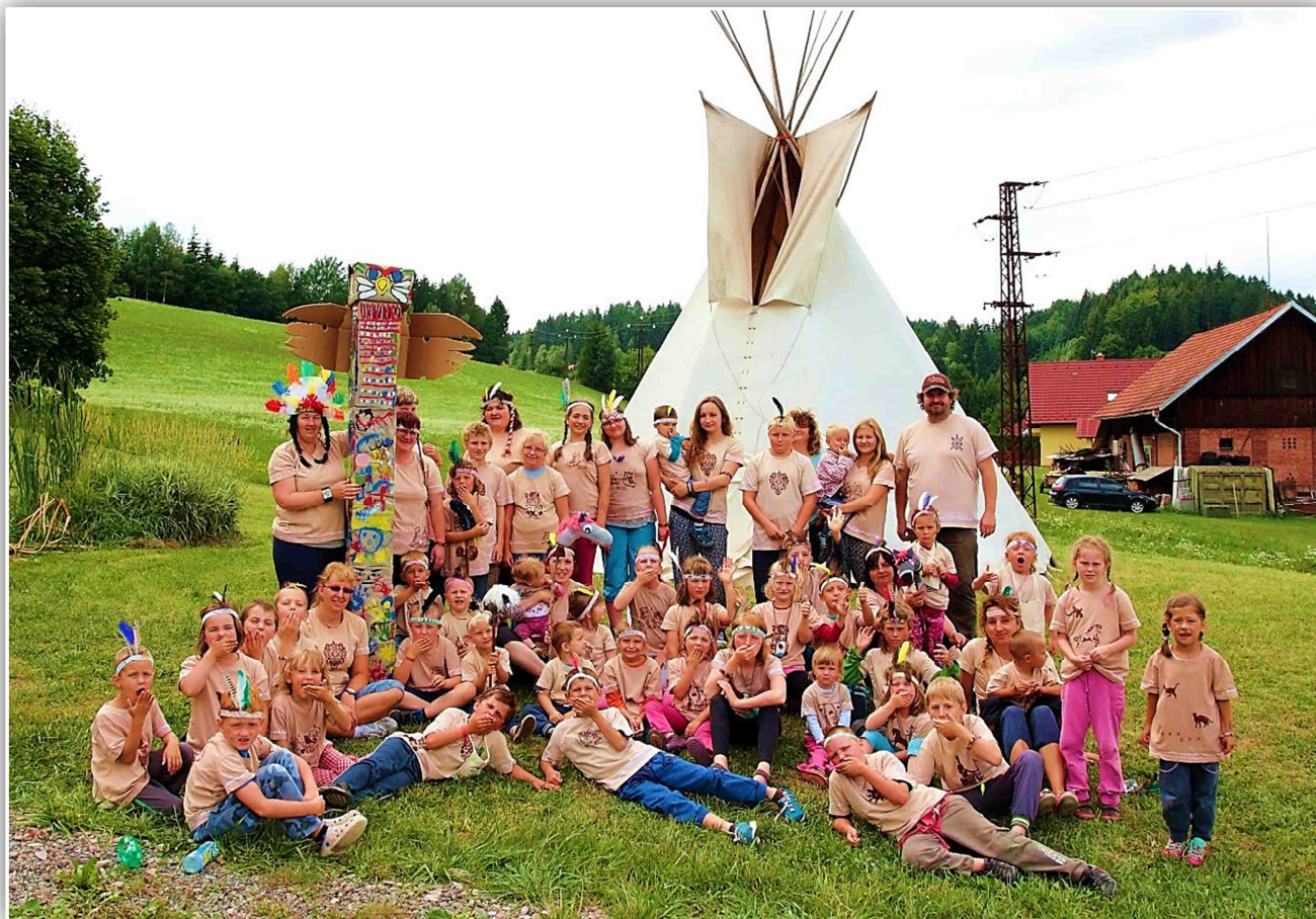
„Dlouhoňovičtí indiáni“ – přivesnický tábor, 13. 7. - 17. 7. 2015. (viz příspěvek na straně 7)