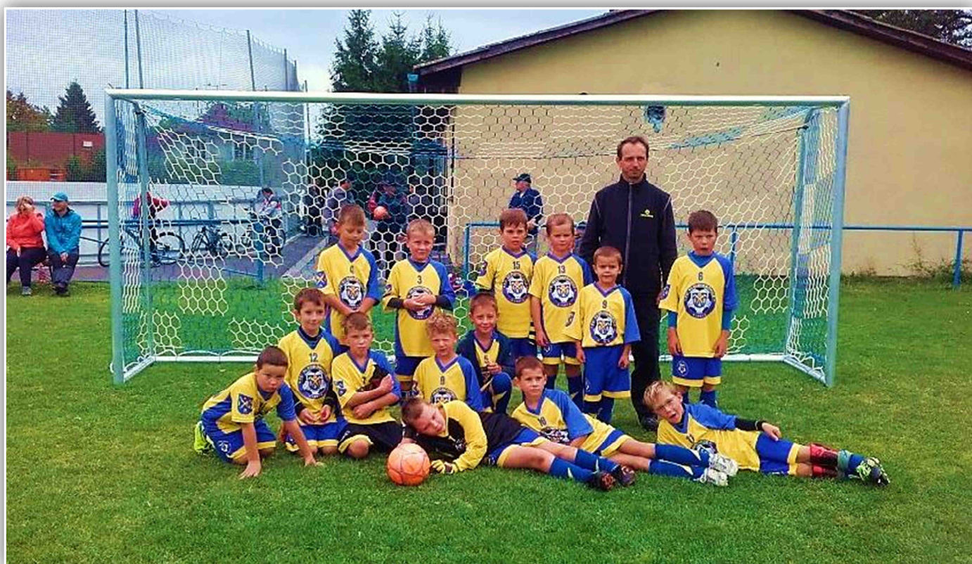
Dlouhoňovická fotbalová budoucnost? Společné foto po domácím turnaji 12. 9. 2015. (viz příspěvek na straně 22)