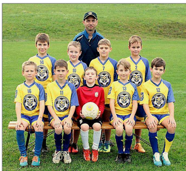
MLADŠÍ ŽÁCI / STARŠÍ PŘÍPRAVKA