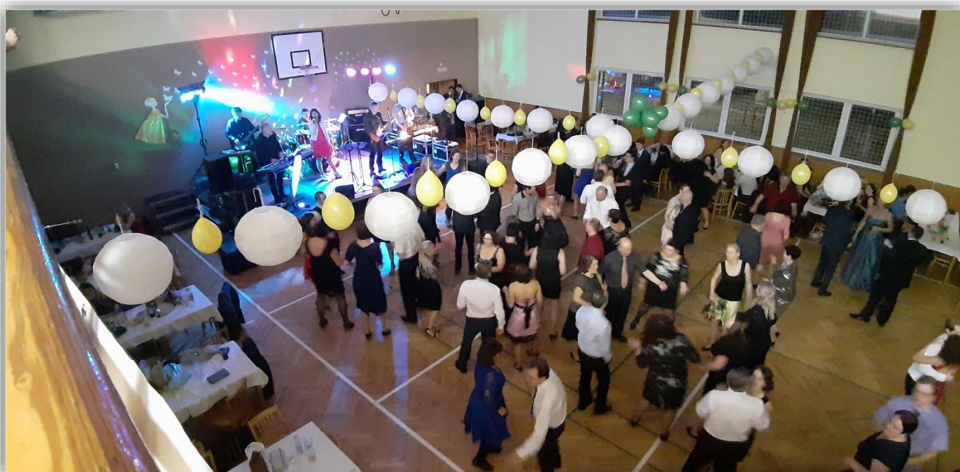
Dorost SDH – platní pomocníci s přípravou i průběhem plesu