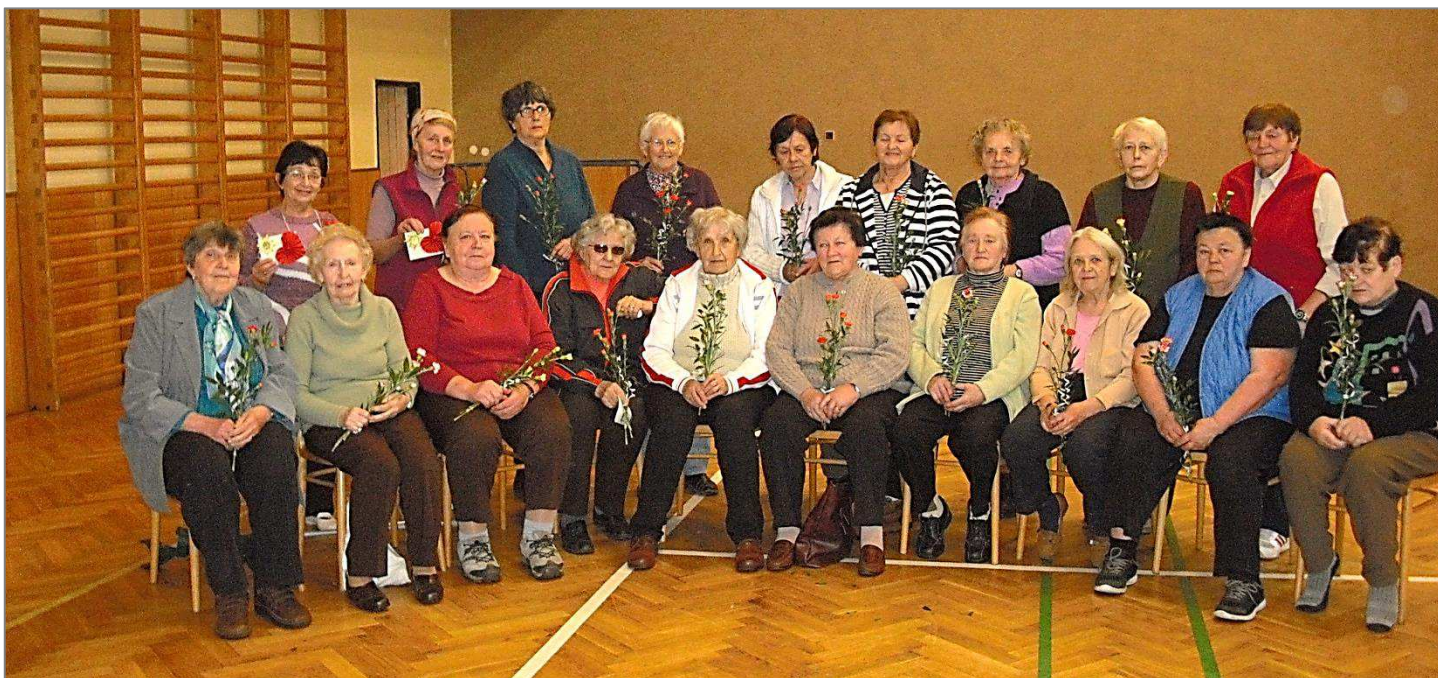
DLOUHOŇOVICKÉ CVIČENKY – viz příspěvky na straně 12 a 13 tohoto Občasníku