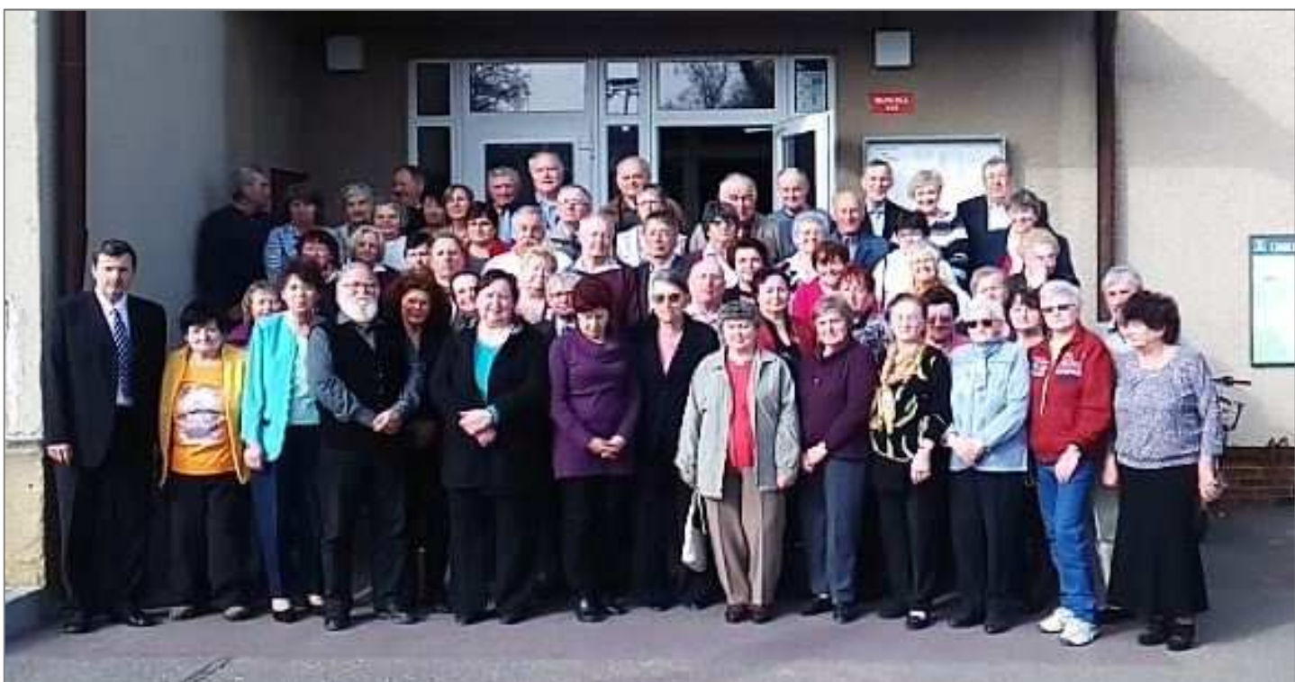
3. 4. 2016 – setkání důchodců se zastupiteli obce (viz příspěvek na straně 14 Občasníku)