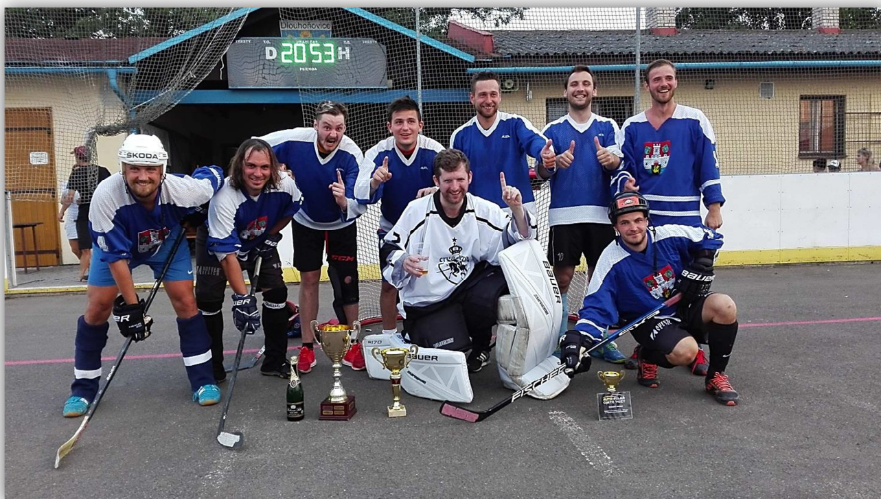
Vítěz Kapřího poháru Dlouhoňovice (23. 7. 2016)