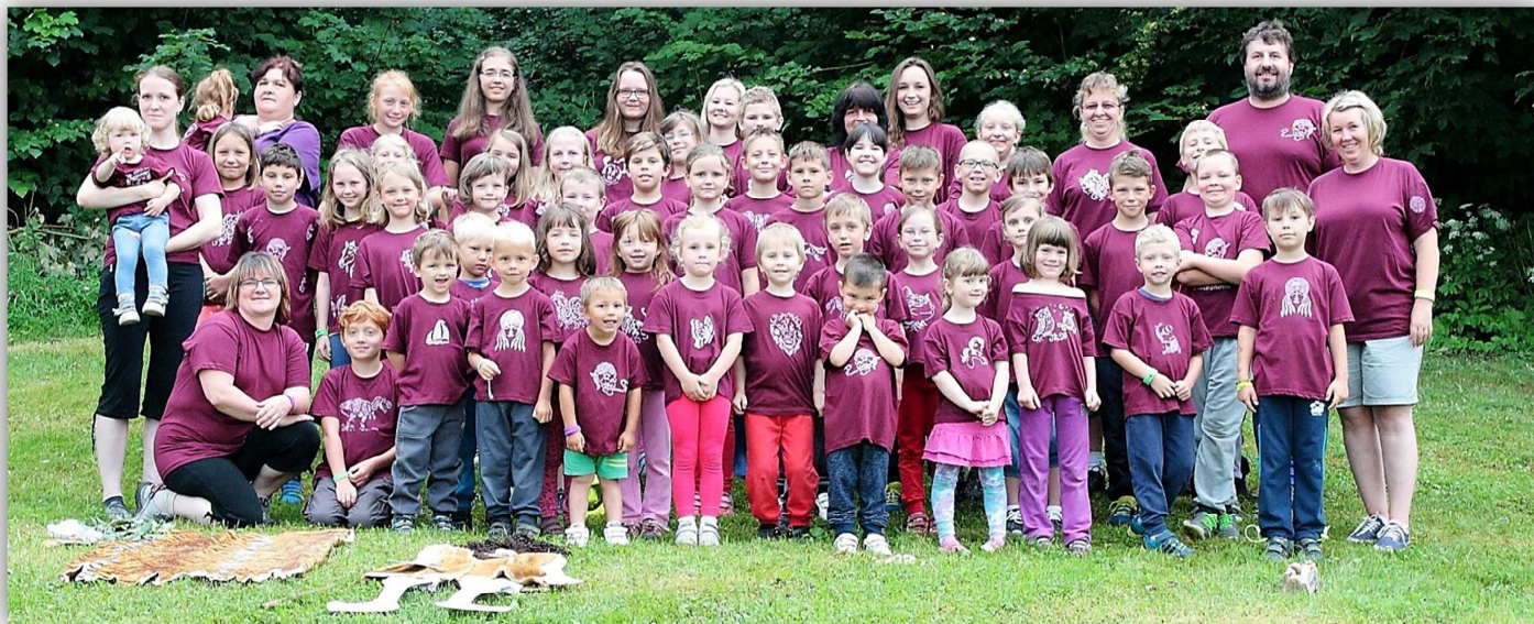
„Sousedské hlídání“ Dlouhoňovice (11. – 15. 7. 2016)