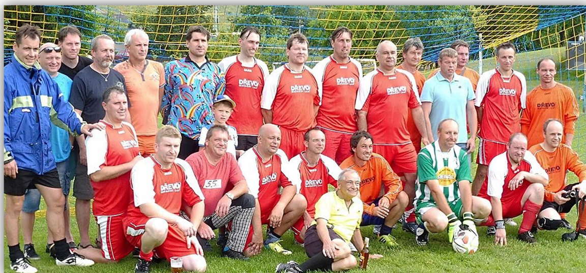
25 let fotbalu v Dlouhoňovicích (2. 7. 2016)