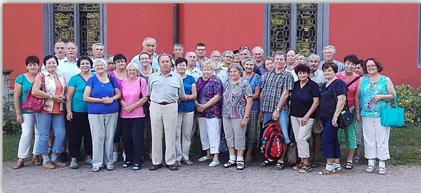
Výlet dlouhoňovických důchodců (24. 8. 2016)