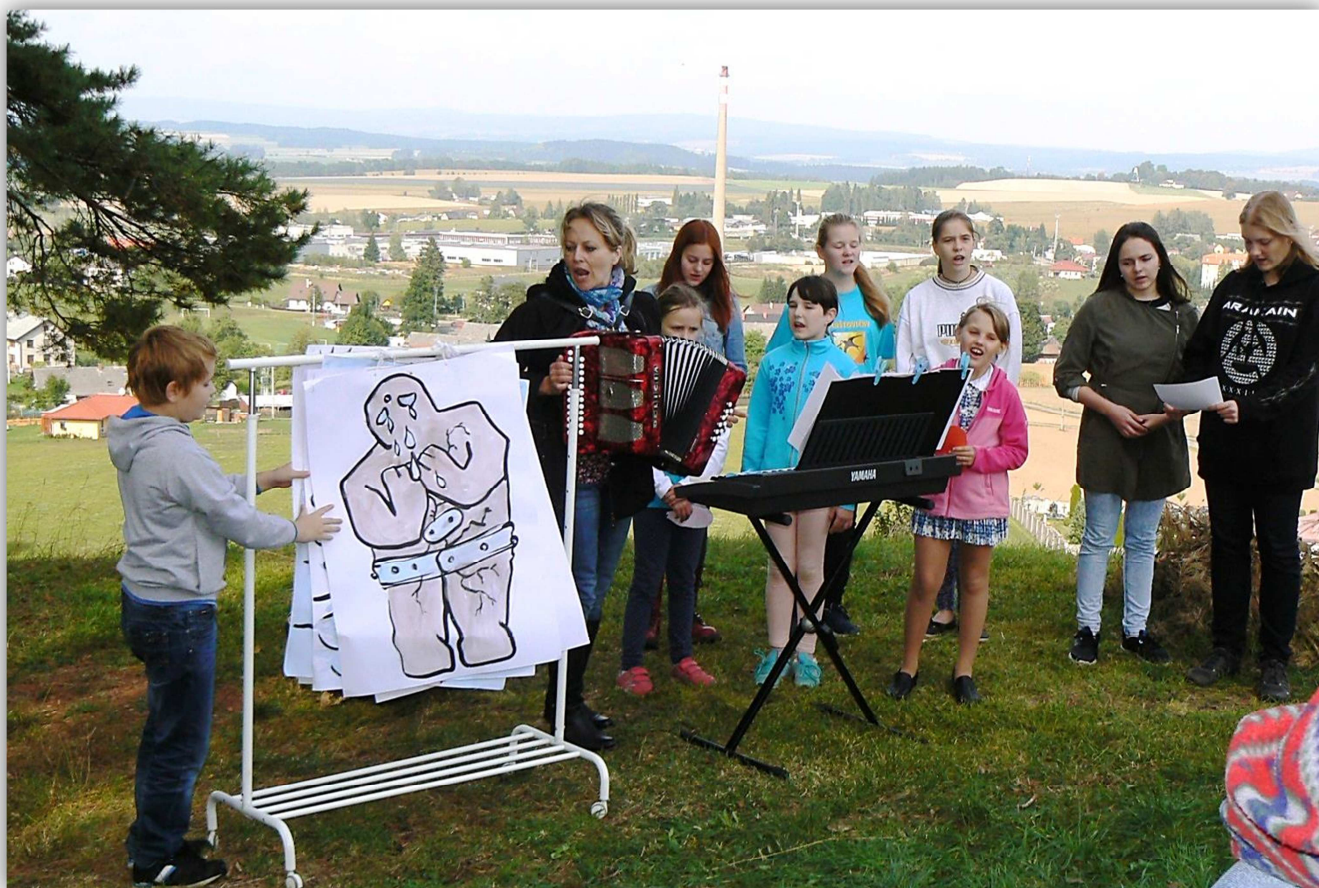
„Vlaštovičky“ ze ZUŠ Petra Ebena ze Žamberka na Výhledně (24. 9. 2016)