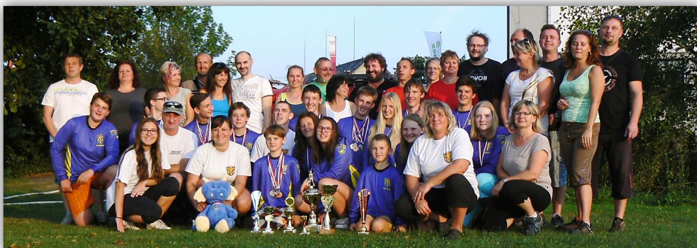
Loučení s úspěšnou sezónou mladých hasičů (16. 9. 2016)